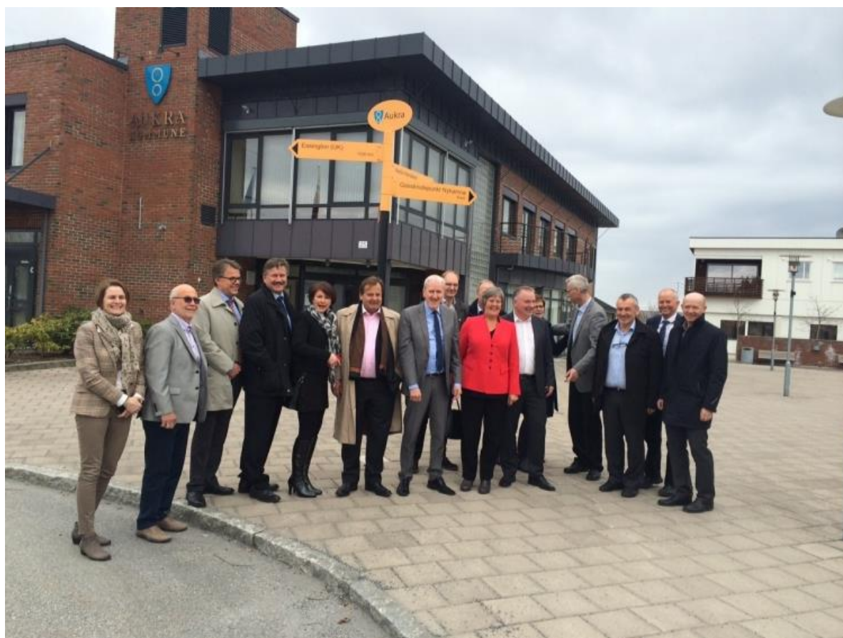
Et knippe av gamle og nåværende aktører i og rundt Ormen Lange var samlet på Aukra 2.april for å markere 10 år siden Stortingsvedtaket.

Rapporten fra analysen fra Møreforskning er ferdigstilt og kan lastes ned på norsk eller engelsk fra www.mfm.no/index.cfm/pageID/2015 .